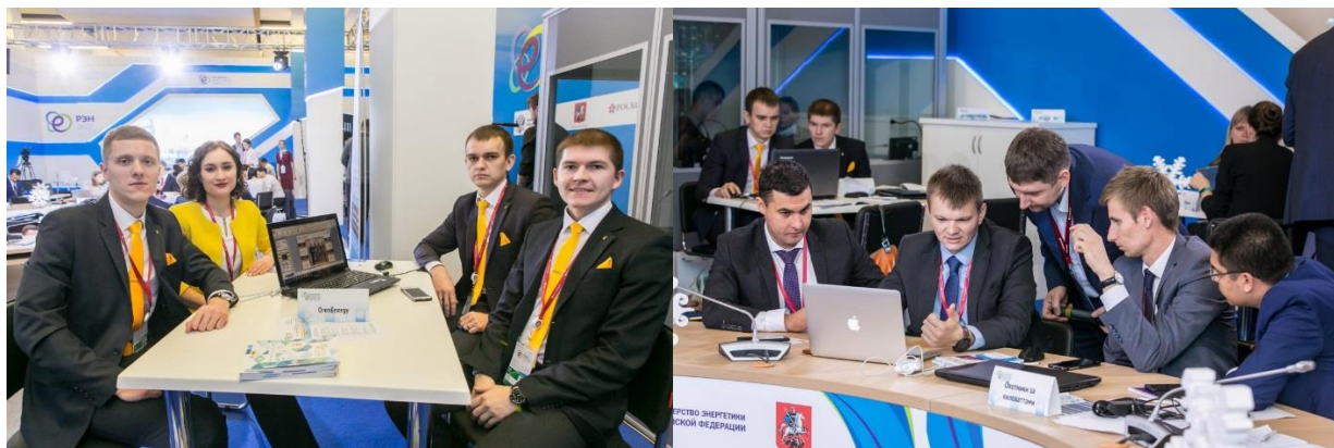
Рис.1-2 – Молодые специалисты компании в рамках Молодежного дня Российской энергетической недели

Пример проведения Лиги молодых специалистов «CASE-IN®» на полях Российской энергетической недели 2017.